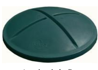
standardní víko se zámký

Doporučené prodejní ceny bez DPH, platné od 1.4.2019 do 31.3.2020