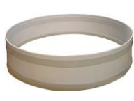
nástavec na ČOV