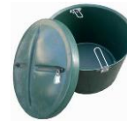
šachta na dmychadlo