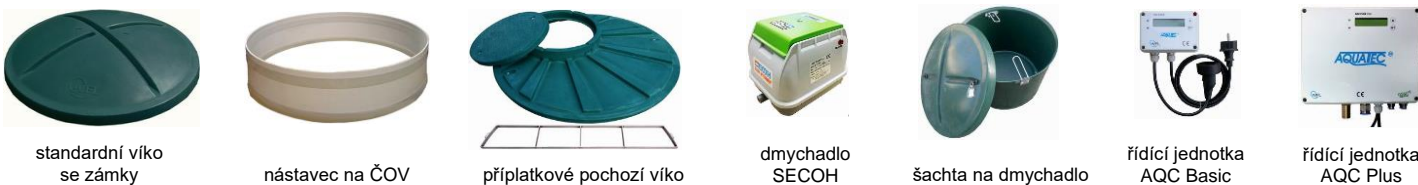
standardní víko se zámky

Doporučené prodejní ceny bez DPH, platné od 1.3.2020 do 28.2.2021