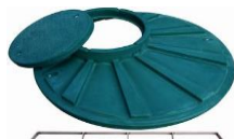
příplatkové pochozí víko