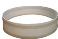
nástavec na ČOV