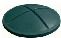
standardní víko se zámků

Doporučené prodejní ceny bez DPH, platné od 1.3.2020 do 28.2.2021